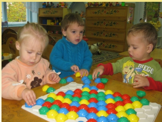
Сенсорный столик (игры на формирование сенсорных эталонов)