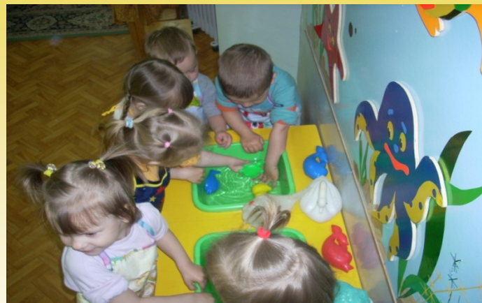
Игры с водой