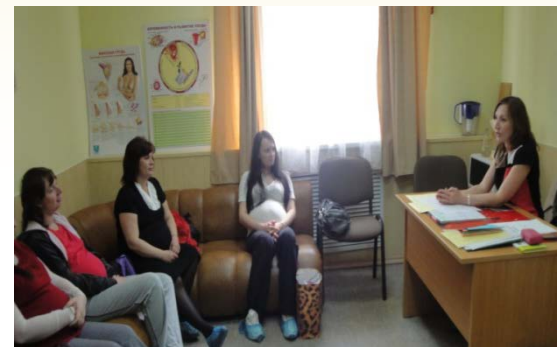
График работы: вторник 1 раз в квартал, с 13.00 до 15.00 часов.

Специалисты: учителя – логопеды и педагог – психолог.