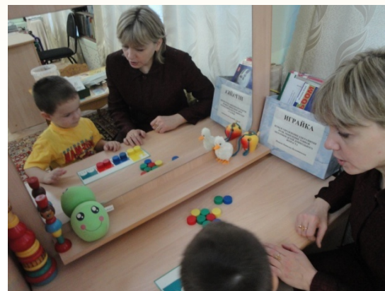
Собери бусы для мамы