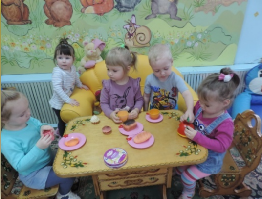
Подражательно – эмоциональная игра «В гостях у куклы»